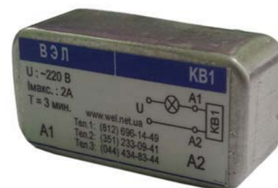
Рис. 1 Внешний вид реле времени для коридорного выключателя KB1.1

Используется для замены механических автоматических выключателей для лестничных клеток типа АВ-01-2,5/220 и АВ-2М.